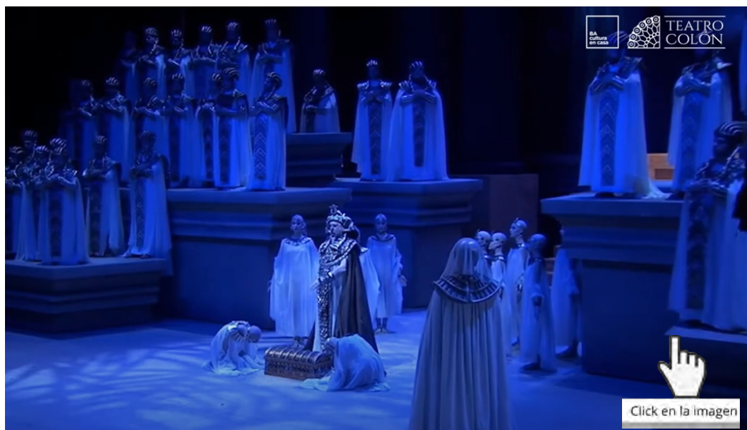
Aida . Verdi. Teatro Colón. Festejo 110 años de la sala

en el espíritu de programar el año que viene tenemos a la cabeza el centenario de la muerte de Puccini, por lo cual de ahí pueden sacar sus propias conclusiones.